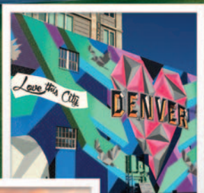
So-GNAR Creative Division