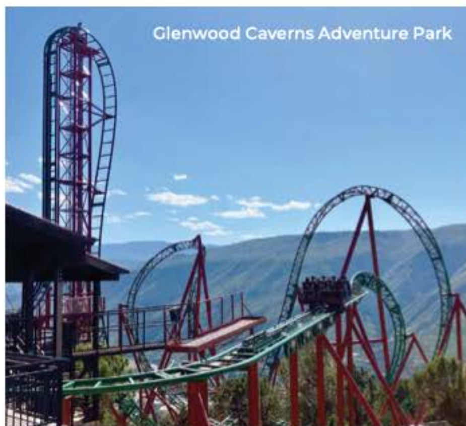
Glenwood Caverns Adventure Park

Où camper : Camp Eddy au 347 Eddy Drive, Grand Junction