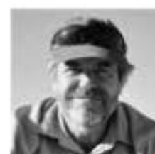
Texte et photos : André Laroche

Avec ses rivières tumultueuses et ses montagnes vertigineuses, le Colorado fait figure d'Eldorado pour tout amateur de grands espaces. Voici six camps de base pour passer du rêve à la réalité, au fil de routes panoramiques à couper le souffle.