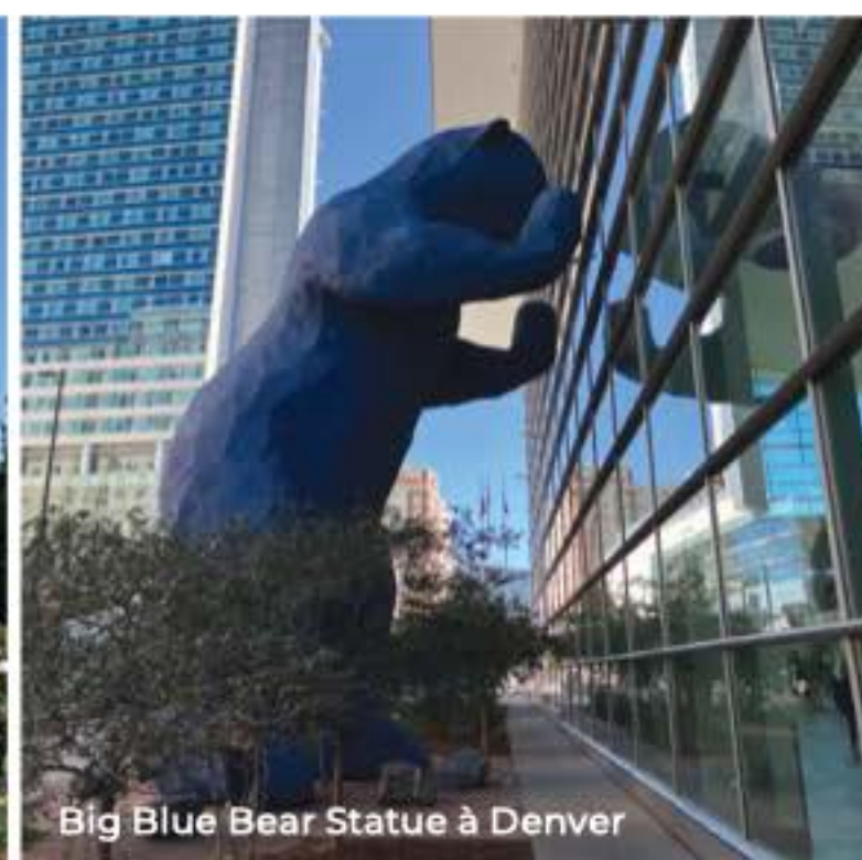
Big Blue Bear Statue à Denver