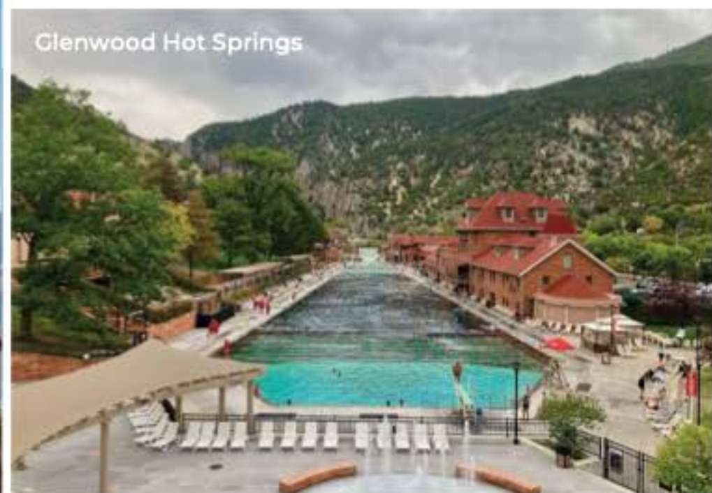
Glenwood Hot Springs

Où camper : Glenwood Canyon Resort au 1308 Co Rd 129, Glenwood Springs