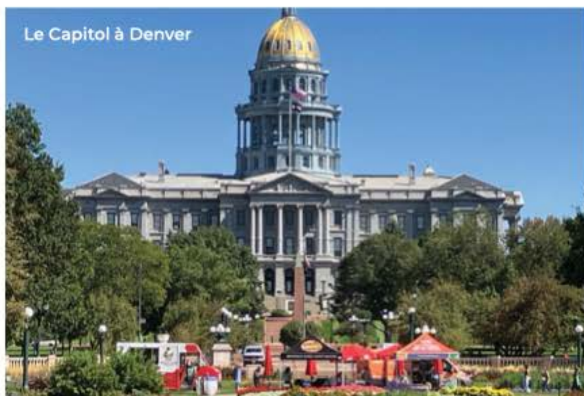
Le Capitol à Denver