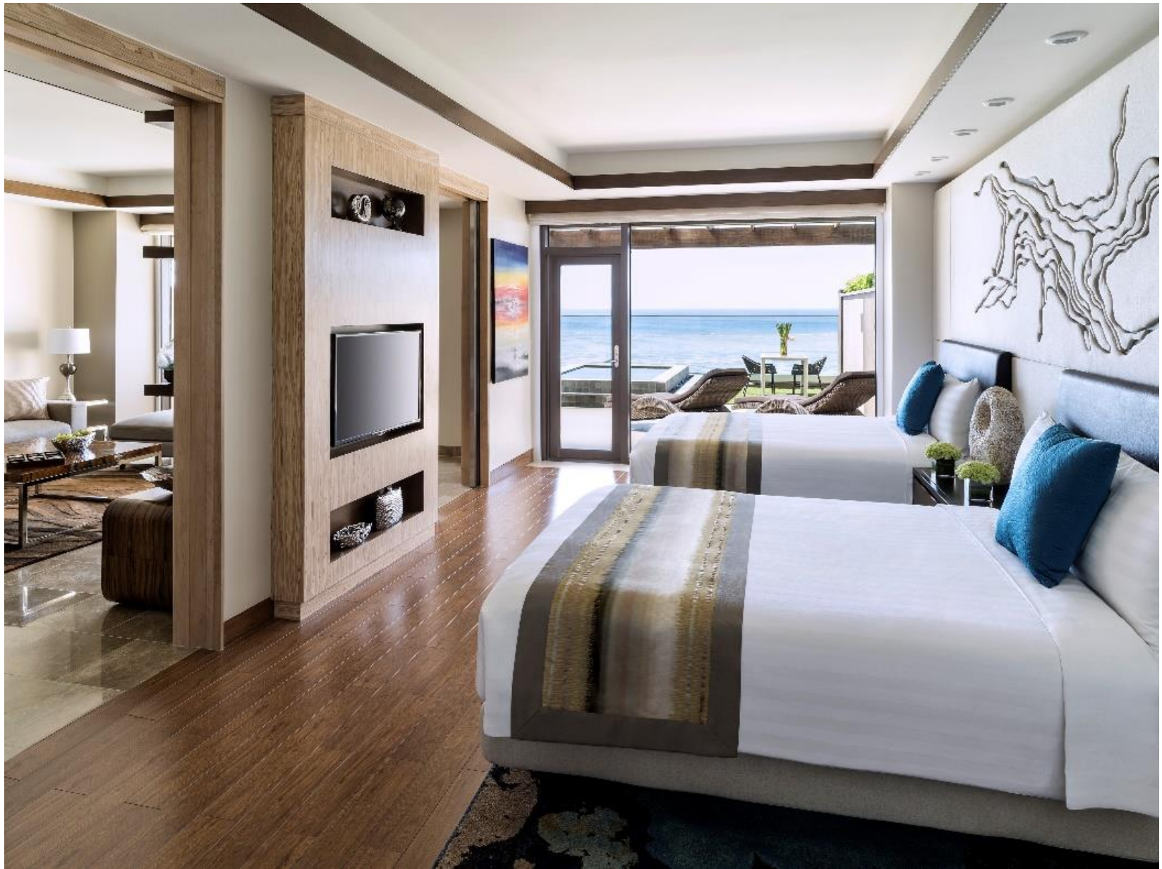
1ベッドルームヴィラ