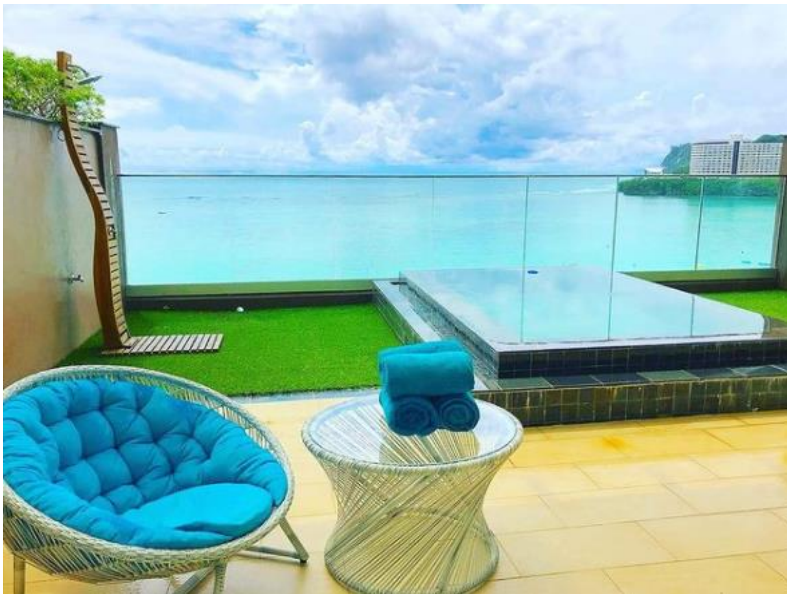
1ベッドルームヴィラ