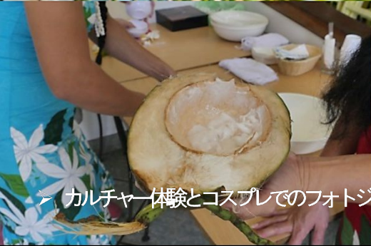
➤ カルチャー体験とコスプレでのフォトジェニック撮影