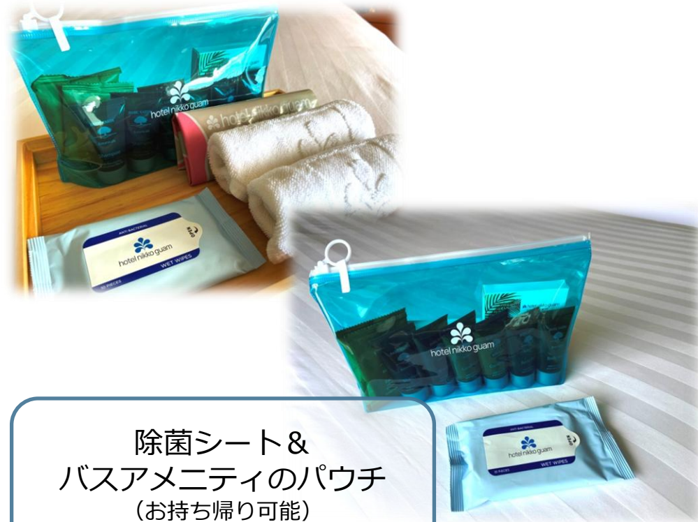
除菌シート & バスアメニティのパウチ (お持ち帰り可能)