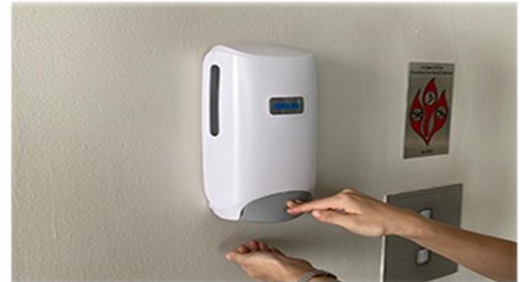
消毒用ハンドサニタイザー設置