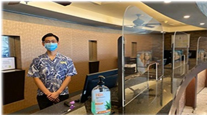
マスク着用・アクリル板設置