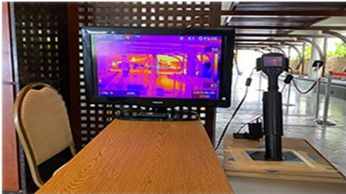
入館時の体温測定