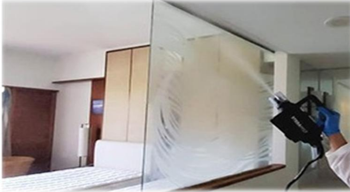
専用除菌機による定期的な除菌