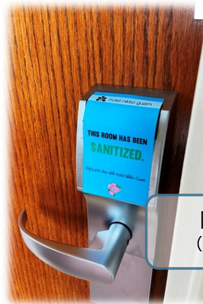
除菌済みドアシール (ご希望時に限り客室清掃)