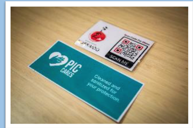
デジタルメニューの導入・除菌の徹底