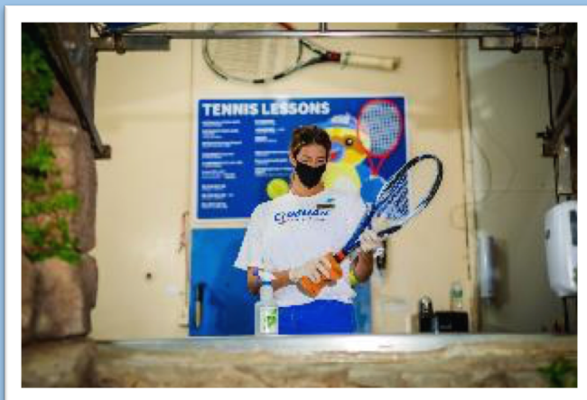
マスク着用・アクリル板の設置