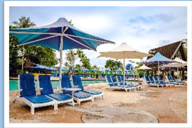
デッキチェア間の距離の確保