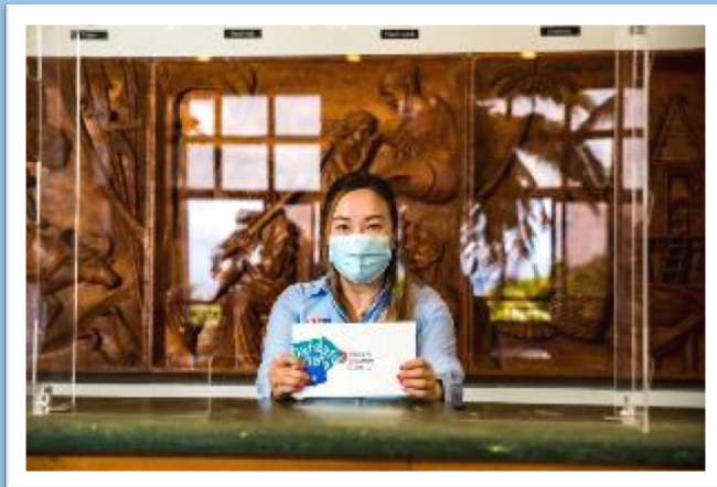
マスク着用・アクリル板の設置