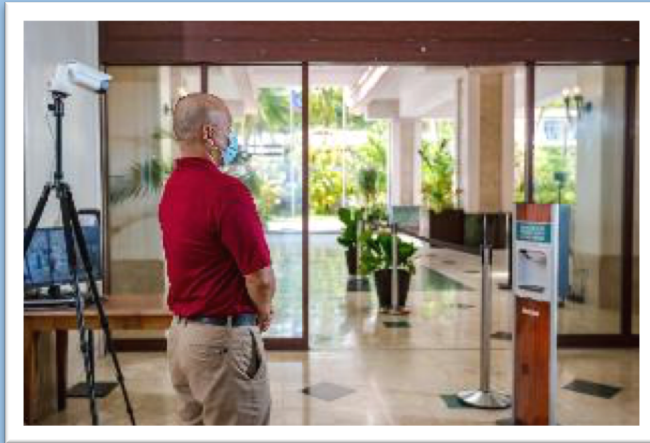
ロビー入館時の検温・消毒剤の設置