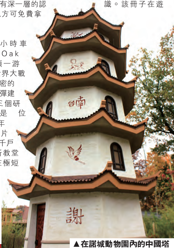
▲在諾城動物園內的中國塔

離諾市半小時車程的橡樹嶺 (Oak Ridge) 是必須一遊之地。在二次世界大戰時，美國最高機密的「曼哈頓」原子彈建造計劃旗下的三個研發實驗室之一便位於此！在1942年時的橡嶺是一大片農地，住了約一千戶農民，只有兩所教堂和一間小學。在極短時間之內美國政府把所有居民遷出，架起鐵絲網圍欄，建立了一個可容七萬五千名科研人員工作