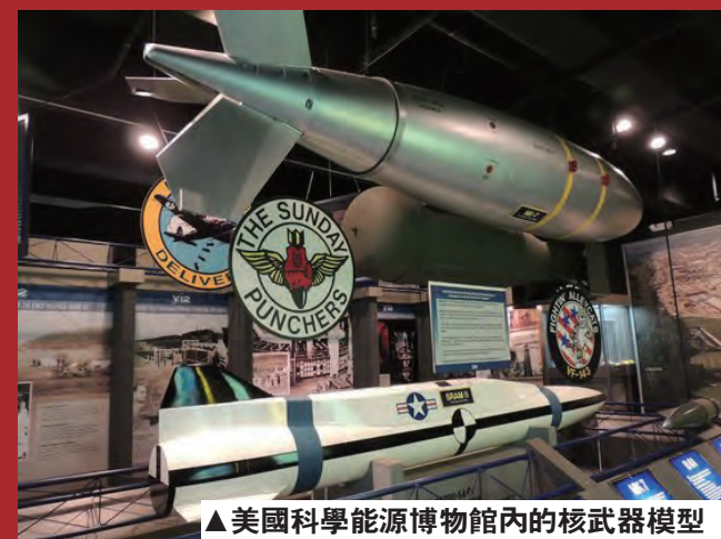
▲美國科學能源博物館內的核武器模型