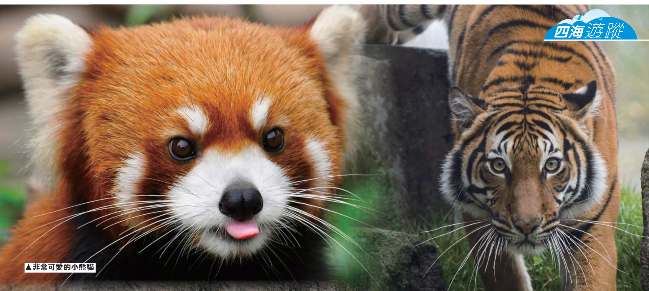
▲非常可愛的小熊貓