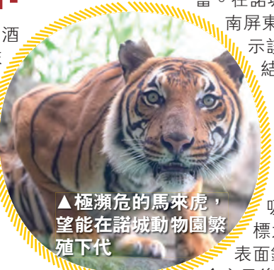
▲極瀕危的馬來虎，望能在諾城動物園繁殖下代

在諾城下榻於豪華的「田納西人」酒店 (The Tennessean Hotel)，早上起床後往附近的「法國市場」(The French Market) 吃過新鮮焗的麵包和即磨咖啡，便直往諾城動物園。此動物園初建於1948年，最初只有數頭動物，但經過七十年的悉心經營，今日已擴展不少，但比起其它北美城市的動物園規模仍不算大。但此園最特別可貴之處在於其飼養的數種瀕危亞洲哺乳類動物，極其珍貴！