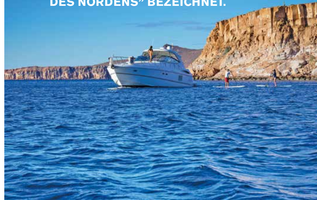
Von links: Transcabo; The Resort at Pedregal; Photomexico