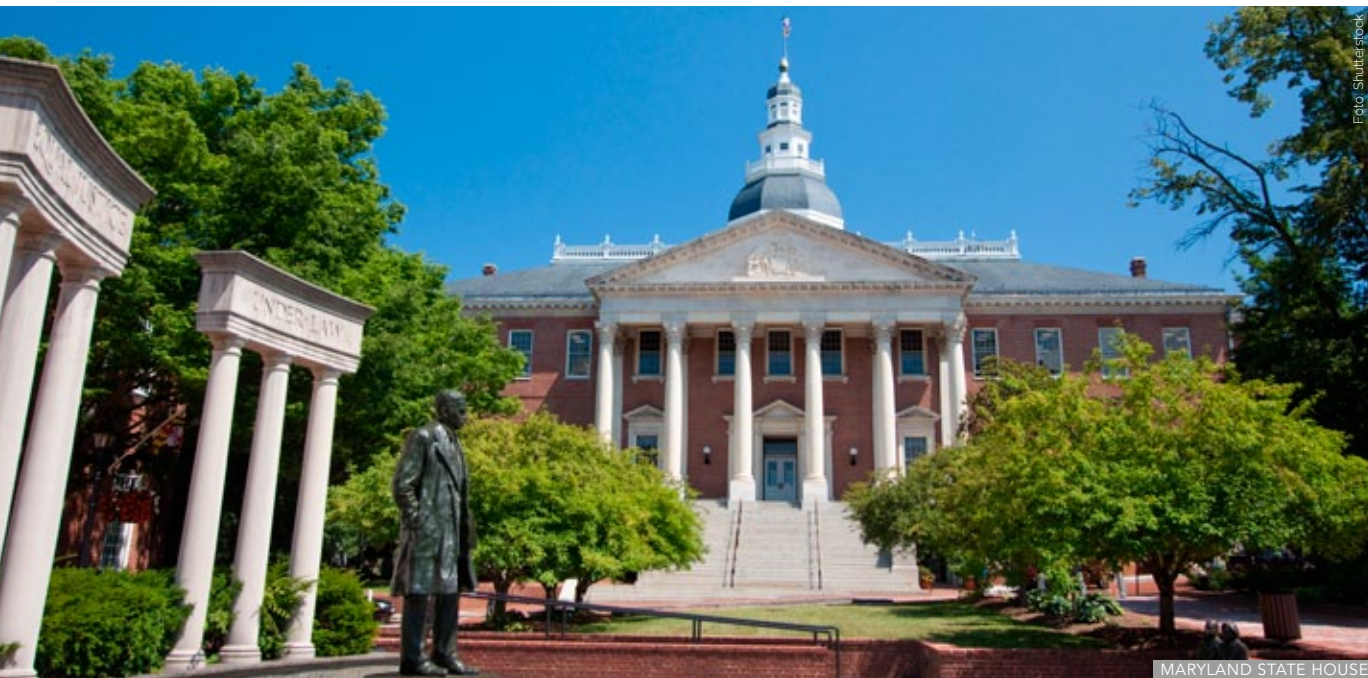
MARYLAND STATE HOUSE

Perto dali, na cidade de Leesburg, uma atração leva a uma viagem pelo passado dos EUA. É a Marshall House ( georgemarshall.org , US$ 10), casa do general americano responsável pelo plano que, batizado com o seu sobrenome, reergueu a Europa após a Segunda Guerra. Mesmo que você não saiba muito sobre política (o que pode ser resolvido com o vídeo exibido no início do tour), a visita vale a pena porque é um mergulho na vida cotidiana do século 20. A casa guarda decoração e mobília originais ou réplicas, desde a sala de estar até os banheiros, do papel de parede às embalagens de mantimentos. A biblioteca, cômodo preferido do general, exibe um rádio e uma TV das antigas, enquanto a cozinha, precedida por uma bela sala de jantar, exibe utensílios e eletrodomésticos com cara do que hoje chamamos de “retrô”.