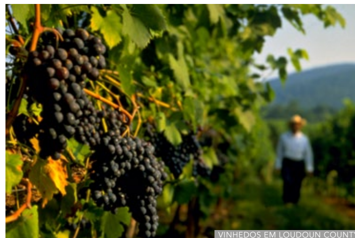
VINHEDOS EM LOUDOUN COUNTY

O condado de Loudoun é especialmente famoso pelos seus vinhos – tanto que leva a alcunha de “DC’s Wine Country”. São cerca de 40 vinícolas espalhadas por uma região de belas paisagens rurais. As propriedades abrem para visitaç o, tours guiados e degustaç es, como a Barns at Hamilton Station Vineyards ( thebarnsathamiltonstation.com ), gerenciada por um casal em um antigo celeiro revitalizado. Eles produzem dez tipos de vinhos, que podem ser degustados por US$ 7 e comprados por valores entre US$ 20 e US$ 40. Nos fins de semana, promove jantares e piqueniques no amplo gramado. Tamb m as destilarias t m se destacado em Loudoun County. Uma boa pedida   visitar a Catocotin Creek ( catocotincreekdistilling.com ), em Purcellville, que tem produç o artesanal de u sque, gin, brandy e moonshine. Por US$ 5, um tour de 40 minutos mostra o processo na pequena propriedade, que pode terminar no sal o do bar com degustaç o. Se quiser uma experi ncia gastron mica, visite o Clyde’s Willow Creek Farm ( clydes.com ), que combina v rios ambientes em um  nico (e grande!) restaurante de cozinha internacional. »