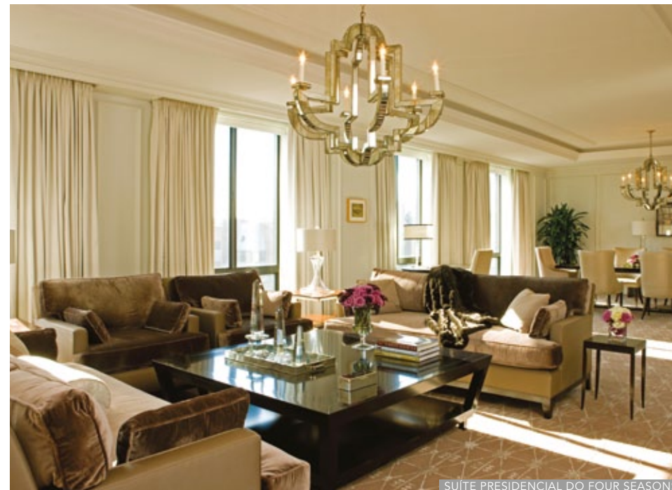
SUÍTE PRESIDENCIAL DO FOUR SEASONS