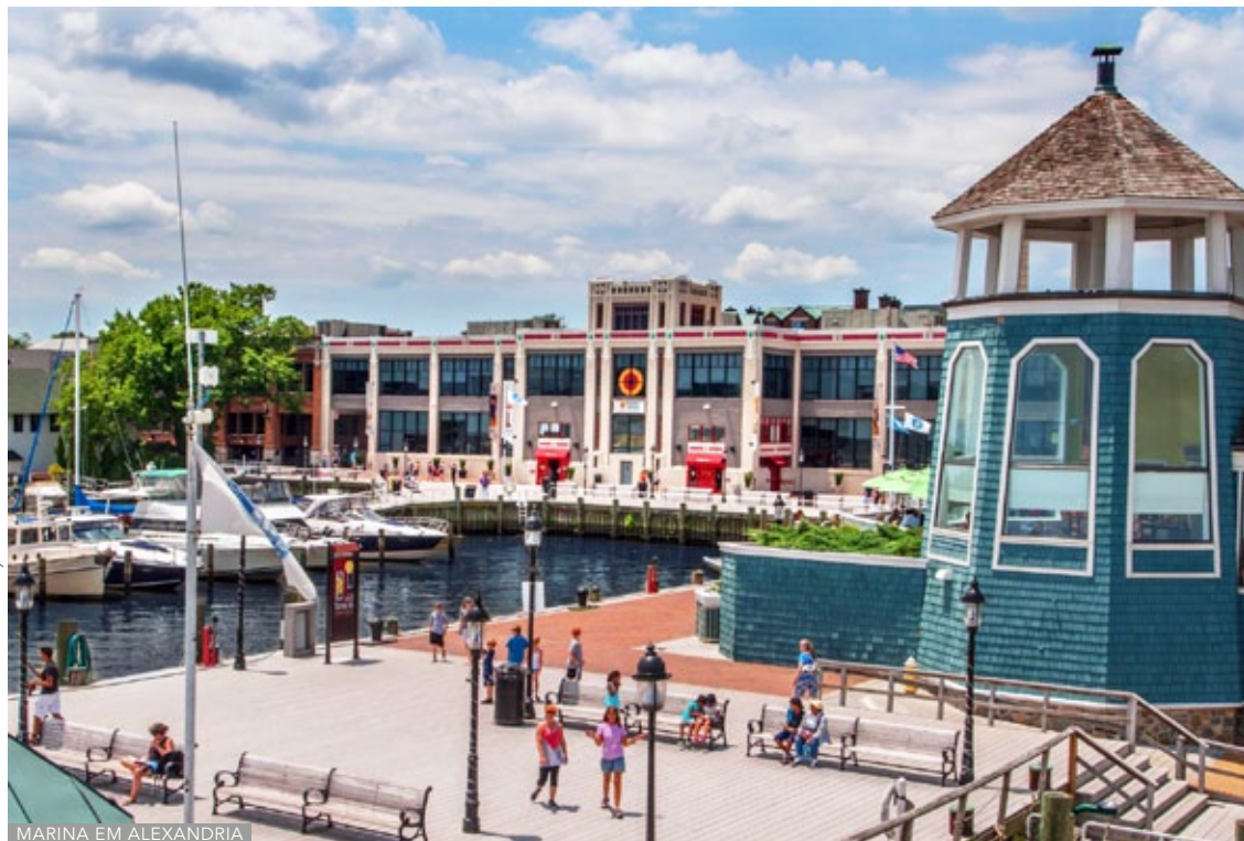
MARINA EM ALEXANDRIA