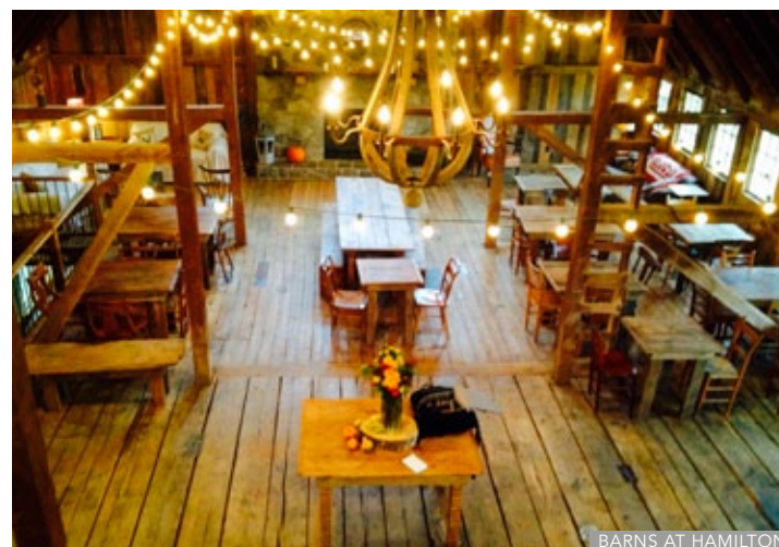
BARNs AT HAMILTON