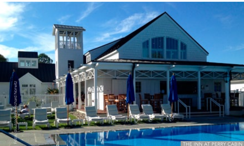
THE INN AT PERRY CABIN

a boa é curtir o agito das docas ou garimpar lojinhas pelas ruelas charmosas. A região é muito pet friendly e se você tem um animal de estimação, vai pitar com as fofuras da Paws ( pawspetboutique.com ), que tem desde roupinhas até docinhos para os bichos. Outra graça, essa para humanos, é a loja de chás Capital Teas ( capitalteas.com ).