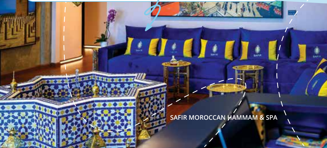
SAFIR MOROCCAN HAMMAM & SPA