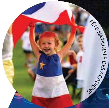
FÊTE NATIONALE DES ACADIENS

Moncton-Dieppe arrive en force avec une grande gamme d'événements et de festivals à ne pas manquer. Qu'il s'agisse de saveurs audacieuses ou de boissons d'exception, de lumières éblouissantes ou d'influences western, comptez sur nous pour vous divertir tout au long de l'année!