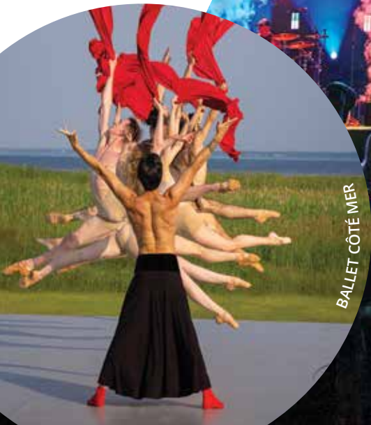
BALLET CÔTÉ MER