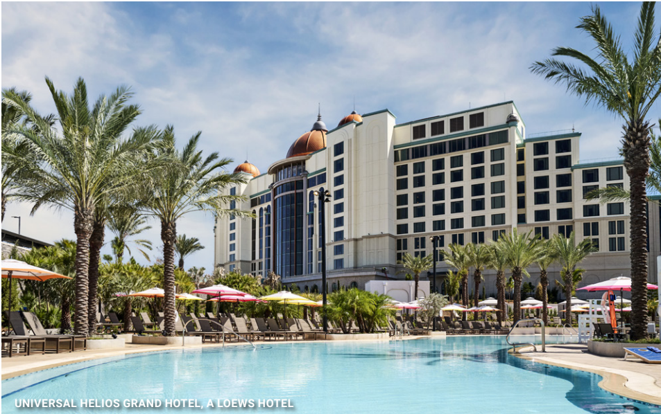
UNIVERSAL HELIOS GRAND HOTEL, A LOEWS HOTEL