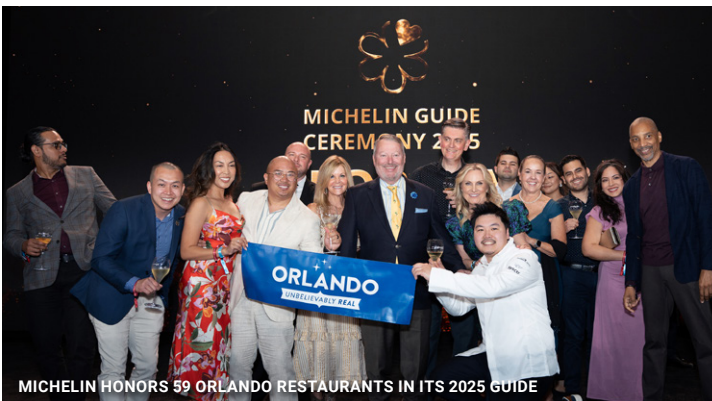
MICHELIN HONORS 59 ORLANDO RESTAURANTS IN ITS 2025 GUIDE