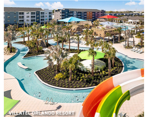
VILLATEL ORLANDO RESORT