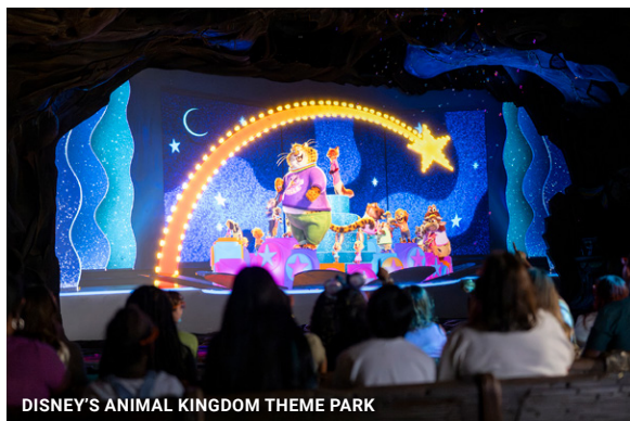
DISNEY'S ANIMAL KINGDOM THEME PARK

LA PRIMERA MONTAÑA RUSA NUEVA EN DOS DÉCADAS ABRIRÁ EN LEGOLAND FLORIDA Galacticoaster, Legoland Florida's la primera montaña rusa en más de dos décadas, despegará el 27 de febrero en la nueva área temática espacial del parque.