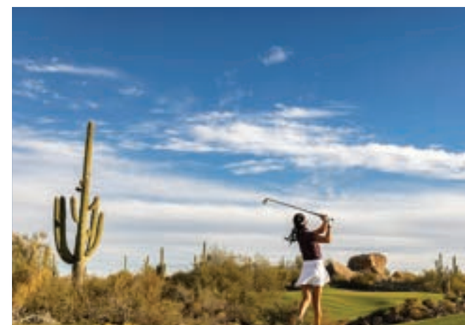
Troon North Golf Club