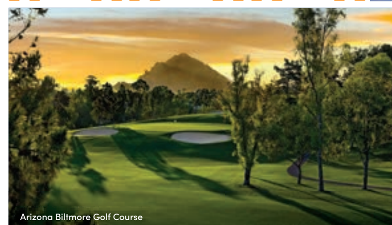
Arizona Biltmore Golf Course

Explorez les trésors cachés et les lieux prisés des habitants, régalez-vous d'une cuisine authentique, et découvrez l'âme de la ville à travers ses délices et ses traditions culinaires qui font la fierté des Phoenicois. Chaque bouchée vous connecte en profondeur au cœur de Phoenix et à la richesse de son héritage culinaire.