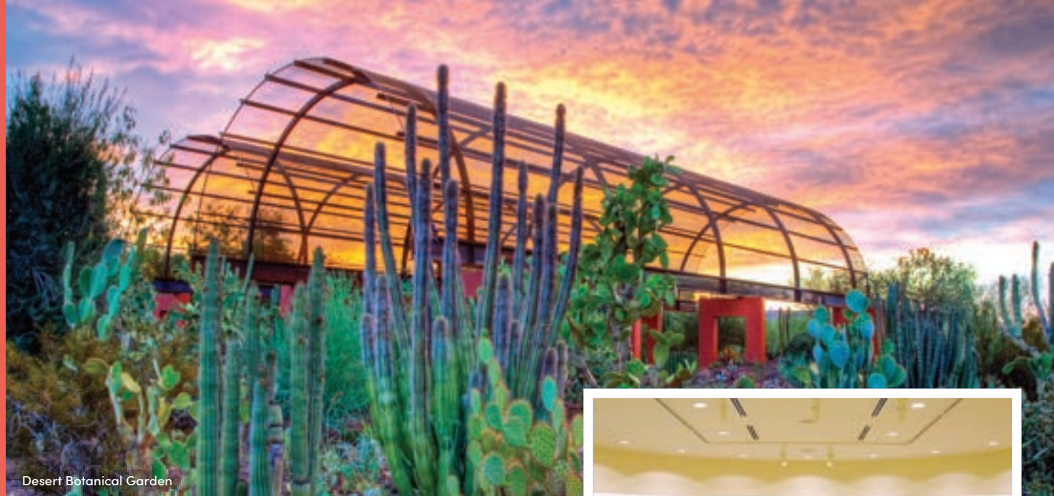
Desert Botanical Garden