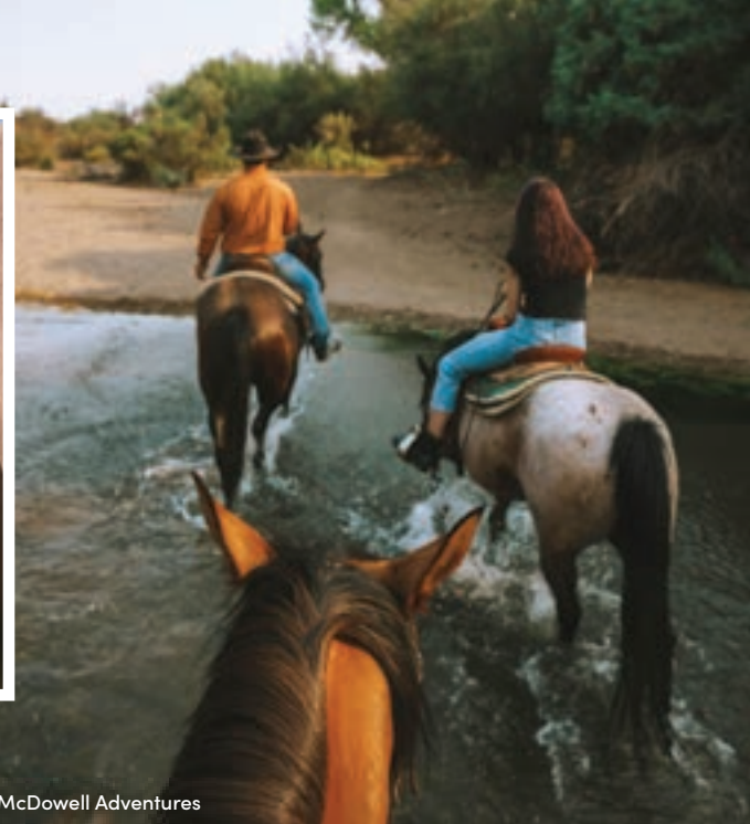
Fort McDowell Adventures