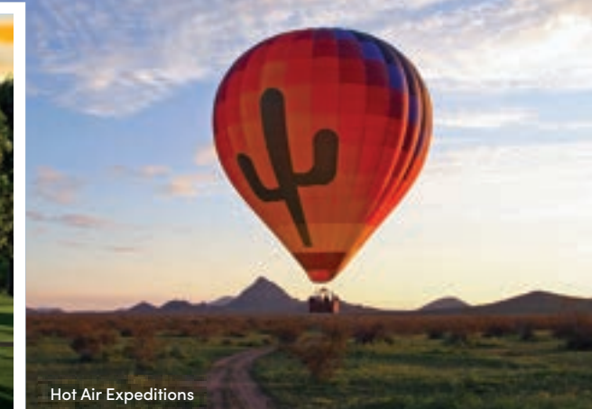
Hot Air Expeditions