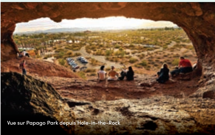
Vue sur Papago Park depuis Hole-in-the-Rock

Pour un trajet pittoresque, avec une récompense à la clé, Dobbins Lookout est le point le plus accessible du parc. Perché à 700 mètres de hauteur, le belvédère offre des places de stationnement, une ramada en pierre, et une petite plateforme d'observation indiquant divers repères de Phoenix, depuis le point de vue panoramique, notamment la Camelback Mountain et le centre-ville de Phoenix.