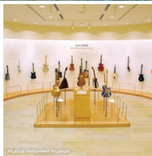
Musical Instrument Museum

Ce musée en plein air présente toute une collection de plantes du désert, originaires du Sud-Ouest, et d'ailleurs. Parmi les succulentes ornant les 22 hectares cultivés du jardin, vous trouverez les arbres d'Afrique du Nord qui rappellent l'univers de Dali, et les immenses cactus de Mésopotamie. Conseil d'initié : inscrivez-vous à une visite guidée.