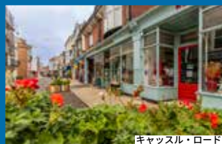
キャッスル・ロード

ポート・ソレントではウォーターフロントのショッピングや食事にぴったりのスポットが楽しめます。ポーツマスには大型店舗やスーパーマーケットが集まる小売パークも複数あり、オーション・リテール・パーク、ノース・ハーバー、ポンペイ・センターなどが挙げられます。