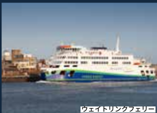
ワイトリンクフェリー