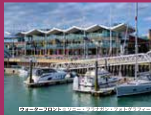
ガンワーフ・キーズのウォーターフロント

ダイニング： 30軒以上のレストラン、バー、カフェが揃い、豊富な食事の選択肢をご用意しております。カジュアルな飲食店から高級レストランまで、様々な料理をお楽しみいただけます。特におすすめは、フランス料理のブラスリー・プラン、ラテン風味のラス・イグアナス、タイ料理のギグリング・スクイッド、そして革新的なカクテルを提供するアルケミストです。