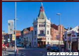
キングス・シアター