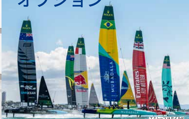
エミレーツ GP セイル GP

ポーツマスは陸上と海上の両方で誇るべきスポーツの伝統を有しており、アクティブに過ごすにも、新しいスポーツに挑戦するにも、あるいは単に市内で開催される大規模なスポーツイベントを観戦するにも最適な場所です。