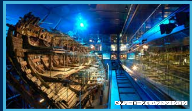
メアリーローズ®のアップシフトクロー

ネルソン提督のHMSビクトリー号に乗り込み、ヘンリー8世のメアリー・ローズ号を探索し、世界初の鉄製船体の軍艦HMSウォリアー号を鑑賞しよう。第一次世界大戦の艦艇HMS M.33の歴史に浸り、造船所周辺の多彩な展示室を巡ろう。日常の英雄たちの物語から、英国海軍の進化を伝える圧巻の展示まで、多彩な展示が待っている。