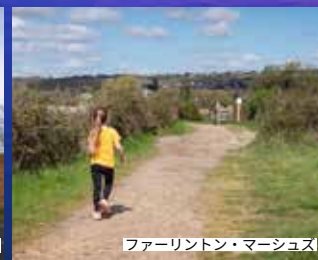
ファーリントン・マーシュス