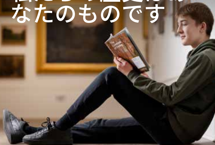
ポーツマス博物館・美術館

ポーツマスは豊かな歴史を有しています。偉大な戦いを目の当たりにし、文学の象徴的存在を育み、さらには王室の結婚式さえも迎えた街です。