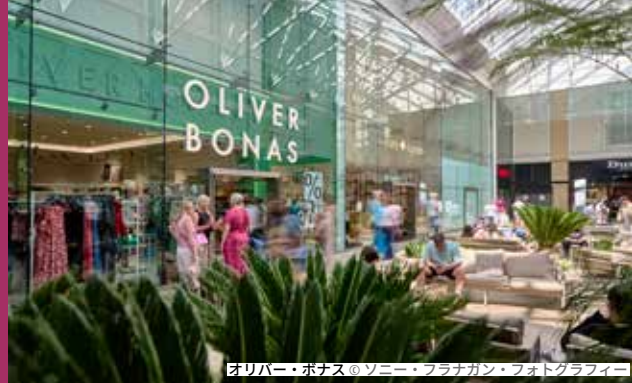
オリバー・ボナスのツニー・フラナガン・フォトグラフィ

ガンワーフ・キーズは英国随一のウォーターフロントショッピング&レジャー施設であり、忘れられない体験をお約束します。活気あふれる雰囲気と多彩な施設が魅力のこの南海岸の名所は、あらゆる年齢層に愛されるでしょう。