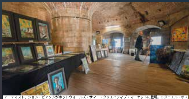
アーティスト、ジョン・ピアンソンがホットウォールズ・サマー・クリエイティブ・マーケットに登場。