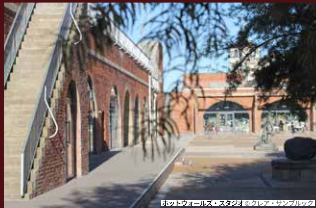
ホットウォールズ・スタジオ

ストロング・アイランド・クロージングは独自の限定版Tシャツ、フーディ、キャップなどを展開。一方、独立系ジュエリーデザイナーのシャーロット・コーネリアス（30年にわたりオーダーメイド作品を制作）とパー