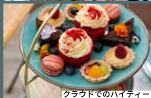
クラウドでのハイティー