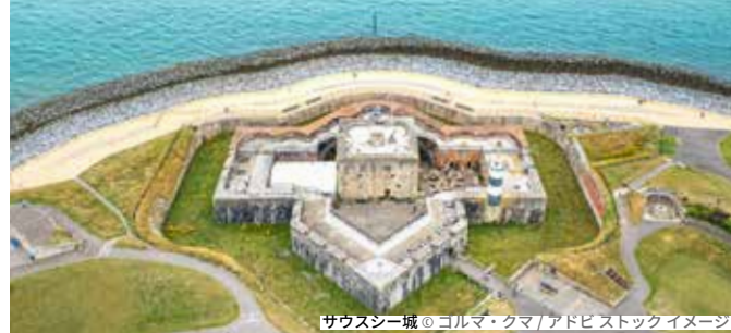
サウスシー城