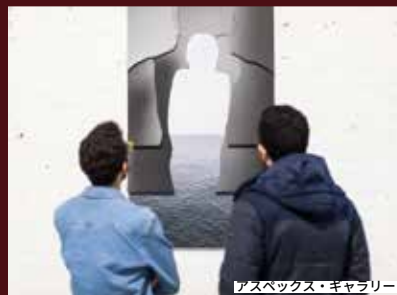
アスペックス・ギャラリー

クラフトドリンクでは、メイクメイク、アーバンアイランド、スタガリンググッド、サウスシー・ブルーイング・カンパニーといった醸造所が、新鮮なクラフトビールを提供するパブやタップハウスを運営している。一方、ポーツマス蒸留所では、歴史ある要塞跡地で蒸留されたラムやジンを試飲できる。