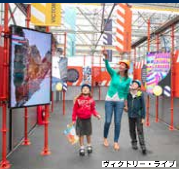
ヴィクトリー・ライブ

ポーツマス歴史造船所で忘れられない冒険を体験しよう！小さな硬貨から巨大なジョージ王朝時代の船まで、珍しい宝物に驚嘆し、海から引き揚げられた息をのむような沈没船を目の当たりにしよう。