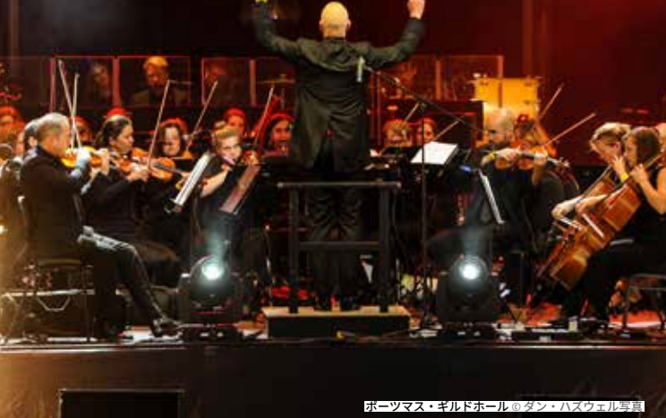
ポーツマス・ギルドホール

ポーツマス・ギルドホールは、この街の文化活動の中心的存在です。新古典主義様式の建物では、著名なミュージシャンやコメディアンが公演が行われるほか、毎年恒例のフェスティバルや、コミコンのような週末にわたるイベントも開催されています。