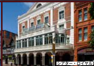
シアター・ロイヤル

バラ・ティップル（数々の受賞歴を誇る英国を代表するジュエリーデザイナーの一人）は、市内のみならずファッション界全体で著名な存在である。