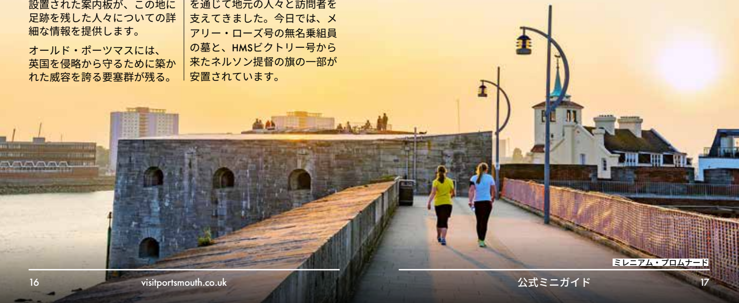
ミレニアム・プロムナード

フォート・ネルソンはポーツダウン・ヒルの頂上に位置し、眼下に広がる市街地（そしてハンプシャーのなだらかな丘陵地帯）を見渡す。内部には王立兵器博物館の重砲コレクションが展示されている。約19エーカーに及ぶ坑道と城壁を探索し、世界各国の兵器を鑑賞しよう。15世紀のトルコ製爆撃砲、200トンもの巨体を持つ鉄道榴弾砲、そして悪名高いイラクの超大型砲「ビッグ・バビロン」などが展示されている。