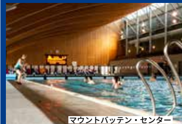
マウントバッテン・センター