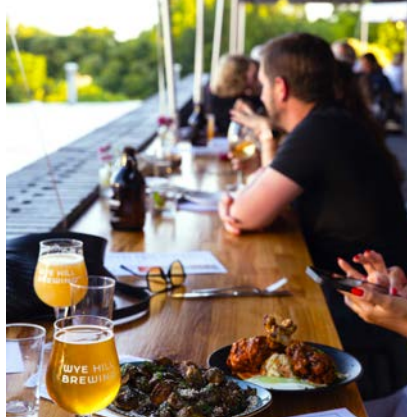
Wye Hill Kitchen & Brewing

La gastronomía es clave en cómo se presenta este destino. En Sam Jones BBQ descubrimos el concepto de whole-hog barbecue , un tipo de asado que se cocina por doce horas. La buena comida no solo vino en forma de lo tradicional. Raleigh cuenta con restaurantes fusión de alto nivel. Madre, con un menú que combina la cocina francesa y española en forma de tapas para compartir, es sin temor a equivocarme uno de los mejores sitios a los que he ido en el mundo.