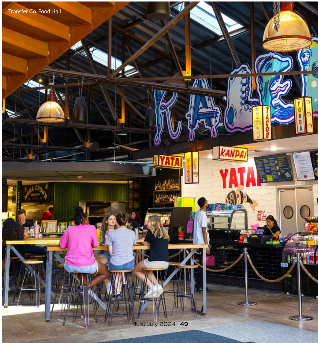
Transfer Co. Food Hall

We stayed in the Warehouse District and, walking through this area, we noticed Raleigh's progress toward becoming a trendy new destination in the southern United States. Ninety percent of the restaurants and businesses in the area are locally owned. We found places to shop and dine, art galleries, technology business incubators, and coffee shops. You can also visit CAM Raleigh (Contemporary Art Museum Raleigh), the Raleigh Denim Workshop, Heirloom Brewshop, and Father and Son Antiques, among other businesses, all housed in a few blocks of former warehouse buildings. Raleigh can be described as offering big-city style with plenty of local products.