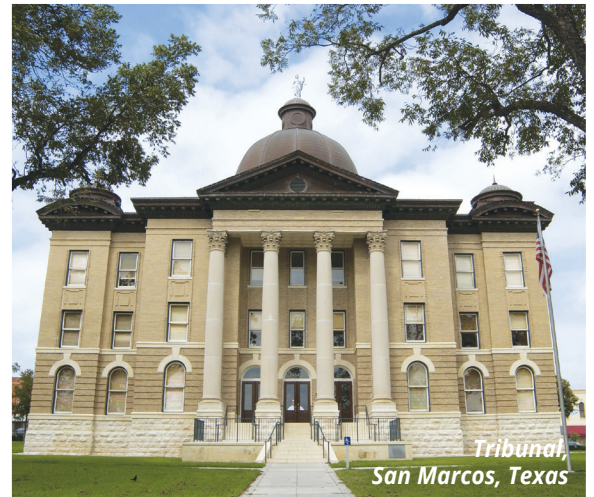
Tribunal, San Marcos, Texas