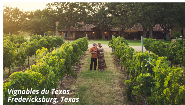
Vignobles du Texas Fredericksburg, Texas