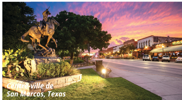
Certifié-ville de San Marcos, Texas