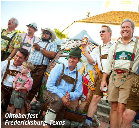
Oktoberfest Fredericksburg, Texas