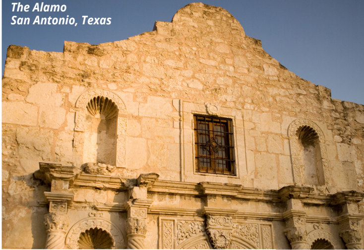
The Alamo San Antonio, Texas

Explorez les attractions culturelles de San Antonio, Fredericksburg, et San Marcos