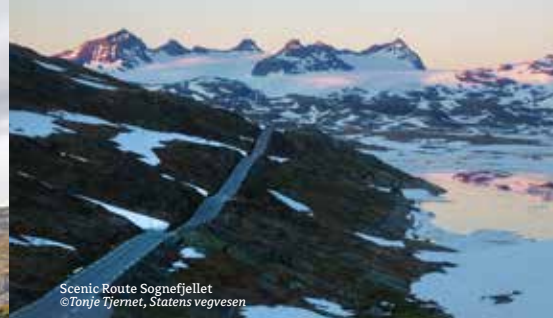
Scenic Route Sognefjellet