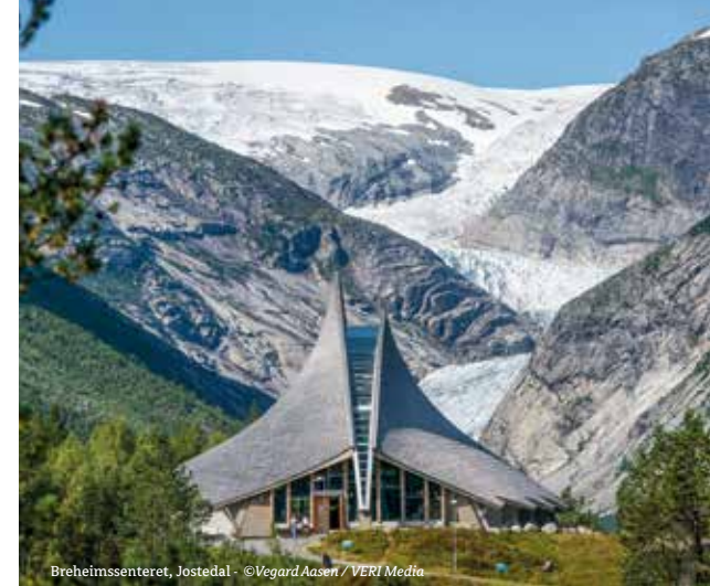
Breheimssenteret, Jostedal

En Jostedalen, Fjærland entre otros lugares, se puede disfrutar de excursiones por los glaciares, guiados por expertos que conocen la zona como la palma de su mano. En el glaciar Nigardsbreen, en Jostedalen, se organizan diariamente excursiones familiares, además de otras actividades a lo largo del verano. Visita los Centros del parque nacional, el Museo Noruego del Glaciar y el Breheimssenteret (Centro de Visitantes del Glaciar Jostedal), para aprender más sobre el Parque Nacional Jostedalsbreen y el Parque Nacional Breheimen.