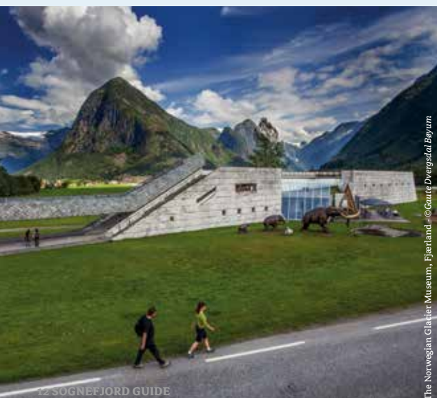
The Norwegian Glacier Museum, Jostedal.

Breheimen es la zona montañosa situada entre los parques nacionales de Jotunheimen y Jostedalsbreen. La excursión a través del valle Mørkridsdalen se considera una de las más bellas de Noruega, y la Asociación Noruega de Senderismo la ha calificado como la ruta con la flora más rica. En la zona hay numerosas granjas de pastoreo de verano y grandes lagos de pesca, que son ampliamente utilizados tanto por los locales como por los visitantes.