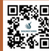
Fjord Cycling

Scannez le QR code et trouvez un endroit pour manger et boire.