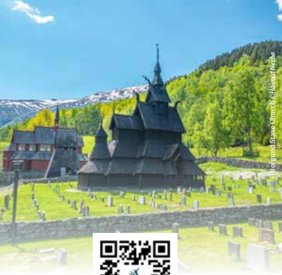
Borgund Stave Church