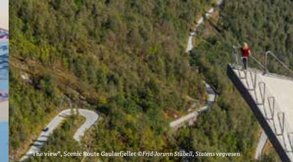
"The view", Scenic Route Gaularfjellet