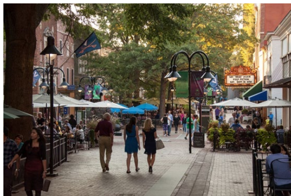
Le Historic Downtown Mall à Charlottesville

L'une des attractions les plus populaires de Charlottesville est le Historic Downtown Mall . Cette avenue pavée de briques traverse le cœur de Charlottesville et sert de centre culinaire, commercial et artistique. Vous pouvez magasiner puis partager un bon repas dans l'un des nombreux restaurants uniques, branchés ou haut de gamme de cette rue piétonnière. Des concerts et des spectacles ont également lieu régulièrement au Paramount Theatre , au Jefferson Theatre , au Southern Café & Music Hall et au Sprint Pavilion , amphithéâtre en plein-air.