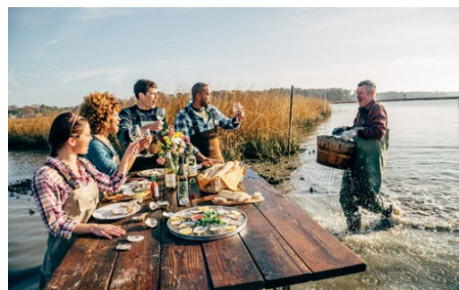
Ferme Pleasure House

Par la suite, préparez-vous à ravir vos papilles avec des créations culinaires uniques. Les restaurants haut-de-gamme abondent à Virginia Beach et les amateurs de fruits de mer se régaleront avec les prises fraîches du jour. Surnommée la capitale des huîtres de la côte Est, la Virginie compte huit régions ostréicoles proposant des saveurs distinctes. Certains spécimens sont salés, d'autres sont sucrés, mais ils sont tous succulents et délicieux et se marient à merveille à un verre de vin de Virginie! La ferme Pleasure House