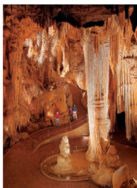
Cavernes de Luray

En conduisant vers le nord sur cette route panoramique, faites un détour vers les Cavernes de Luray , les plus grandes cavernes de l'est des États-Unis. Vous vous sentirez transporté dans un autre monde, entouré de grandes stalactites et stalagmites dans ces grottes gigantesques. Cette merveille géologique abrite également le grand orgue Stalacpipe, le plus grand instrument de musique du monde qui vous séduira par ses sons uniques inoubliables et envoûtants.