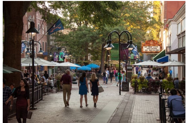
Le Historic Downtown Mall à Charlottesville

L'une des attractions les plus populaires de Charlottesville est le Historic Downtown Mall . Cette avenue pavée de briques traverse le cœur de Charlottesville et sert de centre culinaire, commercial et artistique. Vous pouvez magasiner puis partager un bon repas dans l'un des nombreux restaurants uniques, branchés ou haut de gamme de cette rue piétonnière. Des concerts et des spectacles ont également lieu régulièrement au Paramount Theatre , au Jefferson Theatre , au Southern Café & Music Hall et au Sprint Pavilion , amphithéâtre en plein-air.