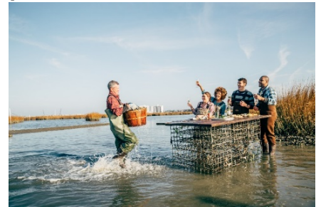
Pleasure House Oysters à Virginia Beach

Après votre journée à la plage, préparez-vous à ravir vos papilles avec des créations culinaires uniques. Les restaurants haut-de-gamme abondent à Virginia Beach et les amateurs de fruits de mer se régaleront avec les prises fraîches du jour. Surnommée la capitale des huîtres de la côte Est, la Virginie compte huit régions ostréicoles proposant des saveurs distinctes. Certains spécimens sont salés, d'autres sont sucrés, mais ils sont tous succulents et délicieux et se marient à merveille à verre de vin de Virginie! La ferme Pleasure House propose une expérience inoubliable, permettant aux amateurs d'huîtres de récolter celles-ci avant de les déguster dans leur milieu naturel.