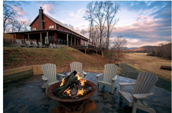
Bold Rock Hard Cider à Nellysford

On explore les nombreuses micro-brasseries dans la région de Charlottesville et le long de la Brew Ridge Trail . On y retrouve des micro-brasseries uniques, notamment Three Notch'd Brewing et South Street Brewery . Quittez la ville pour des brasseries artisanales le long de la Brew Ridge Trail qui offre une vue imprenable sur les montagnes Blue Ridge. Ne manquez pas la brasserie Pro Re Nata Farm et la cidrerie Bold Rock pour l'expérience ultime des boissons artisanales de la Virginie. Passez la nuit à l'un des nombreux hôtels ou auberges de Charlottesville ou encore au spectaculaire Wintergreen Resort niché au sommet des Blue Ridge Mountains.