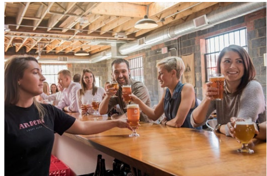
Ardent Craft Ales à Richmond

Direction ouest pour une halte à Richmond , capitale de la Virginie, pour découvrir son industrie florissante de bière artisanale. Située le long de la magnifique rivière James, Richmond allie les commodités des grandes villes au charme chaleureux du sud des États-Unis. Richmond est aussi reconnue pour son abondance de délicieux restaurants en plus de ses attractions culturelles historiques, sa scène artistique dynamique et de nombreuses options pour le magasinage.