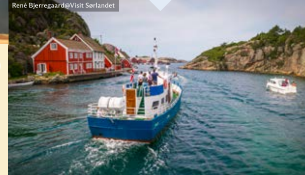
René Bjerregaard@Visit Sorlandet

MB HØLLEN (Kristiansand–Søgne) Interesting boat trip to Søgne. Departure from Pier 6. Interessante Bootsfahrt nach Søgne. Abfahrt von Pier 6. +47 90 05 07 19 | bragdoya.no