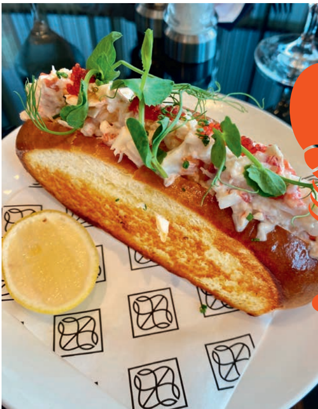
ISTOCK, NYLE KLEIN, AUDREY TARKARAT